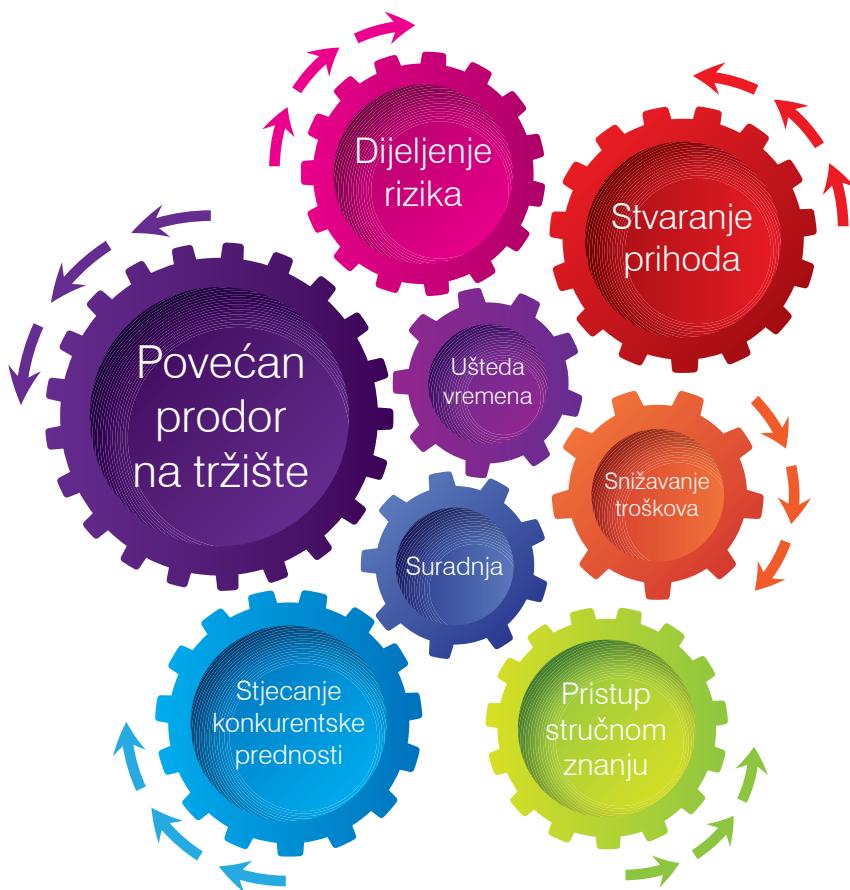
Slika 1. Neke od prednosti davanja ili stjecanja licenci

Ova brošura kao i Kontrolna lista na njenom