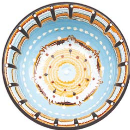
Trojanska keramika, područje oko grada Troje u Bugarskoj

Dok OZP-e nisu vezane određenim rokom valjanosti, zajednički i jamstveni žigovi generalno su zaštićeni na razdoblje od deset godina s mogućnošću obnove.