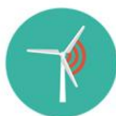
ENERGY & UTILITIES