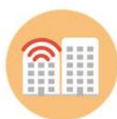
BUILDINGS & INFRASTRUCTURE